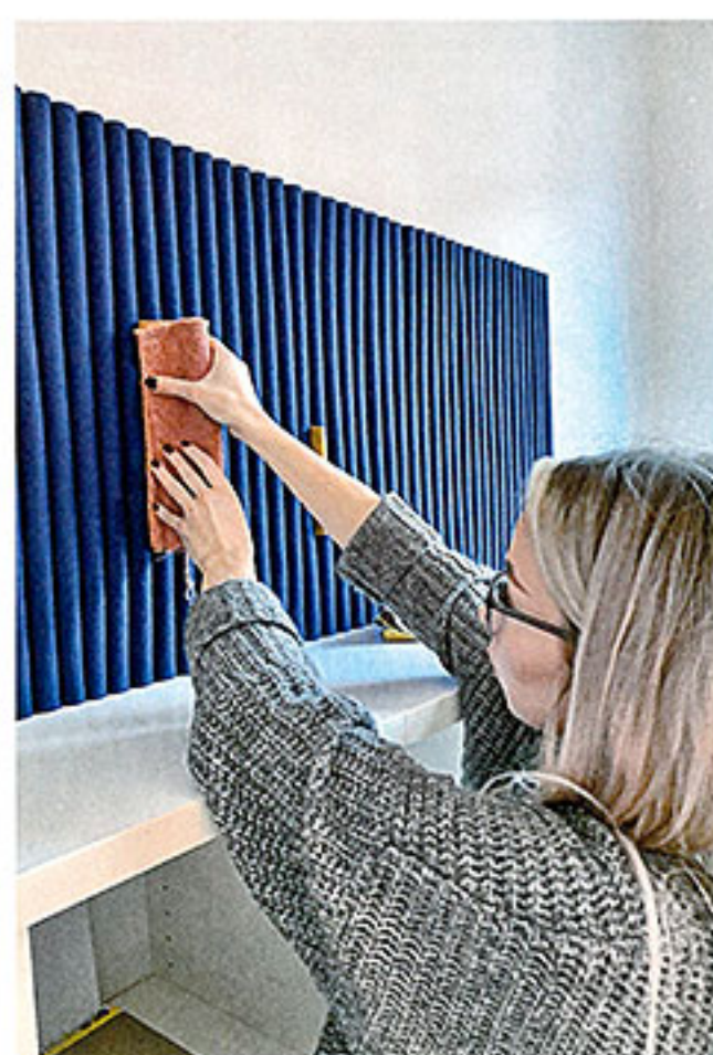
Bei Cubik 3 war man von den vielen Einsatzmöglichkeiten beeindruckt.