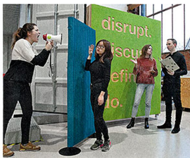
Kleine Welle, große Wirkung meinen Dreiform aus Köln.