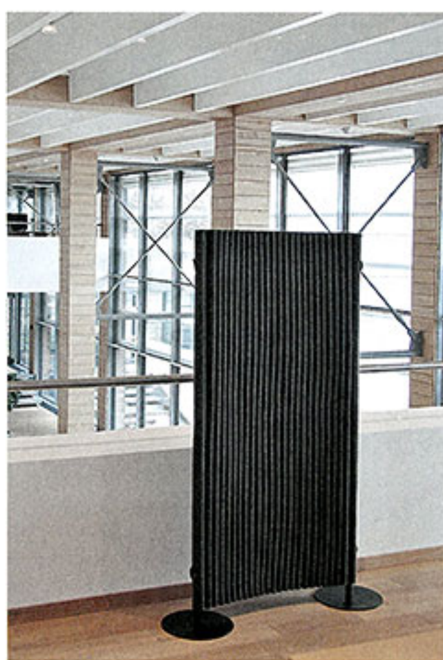
Architekturbüro Grobe aus Hannover testete den geraden Paravent.