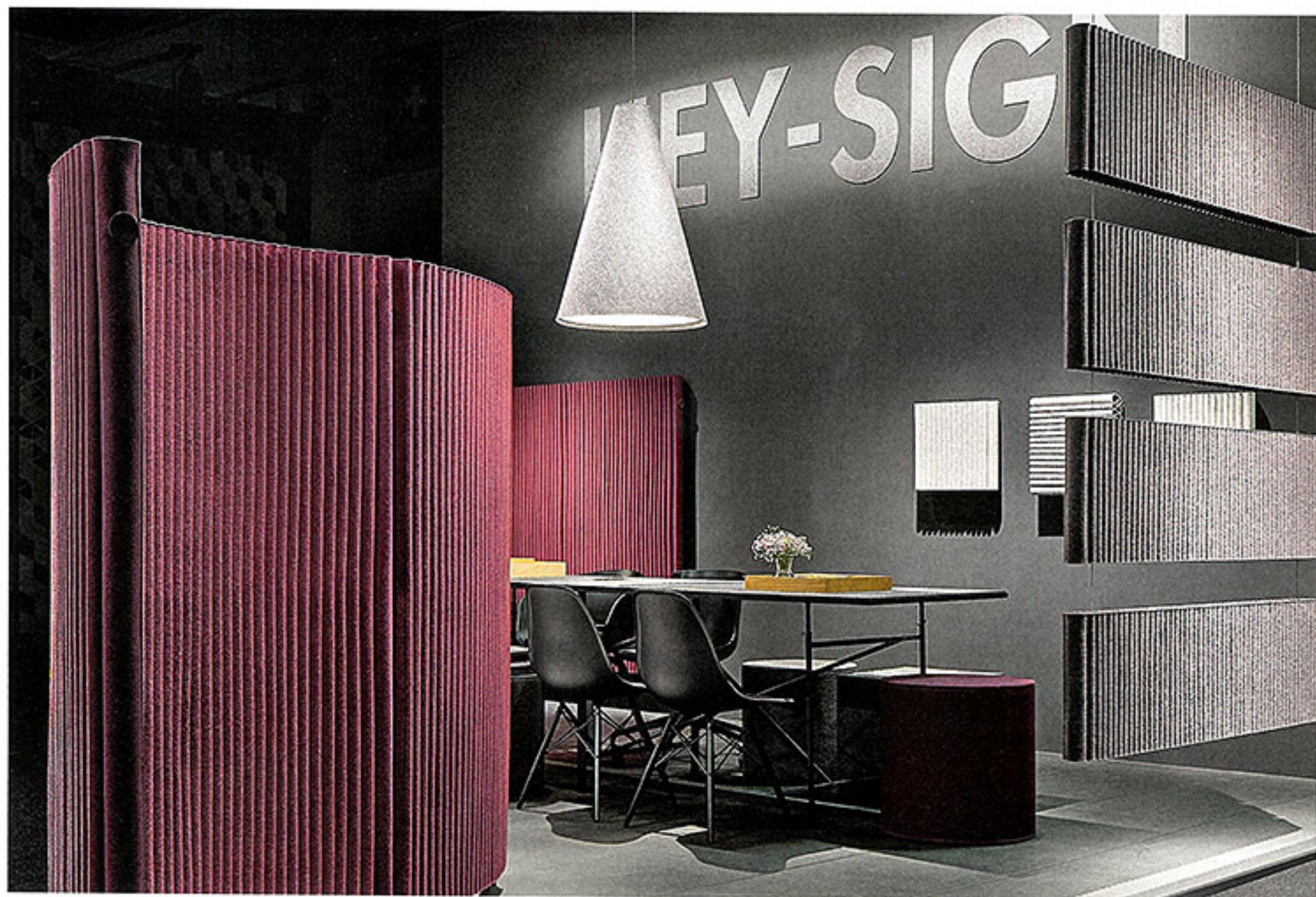
Alle Modelle der Serie WELLE sind in mehr als 40 Farben erhältlich. Der gebogene Paravent eignet sich als perfekte Welle zur Abschirmung von kleinen oder größeren Arbeitsinseln und Ruhezeiten.

ARCHITEKTEN UND INNENARCHITEKTEN TESTEN DIE AKUSTIKSERIE WELLE VON HEY-SIGN