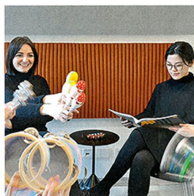
bki machten viel Lärm, das Produkt bestand den Test trotzdem.